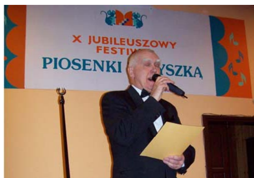
Wręczenie Złotego Liścia Retro IV OFPR'2008 Domowi Kultury Na pięterku