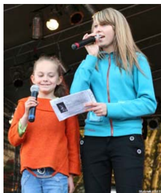
Uczestniczki konkursu karaoke